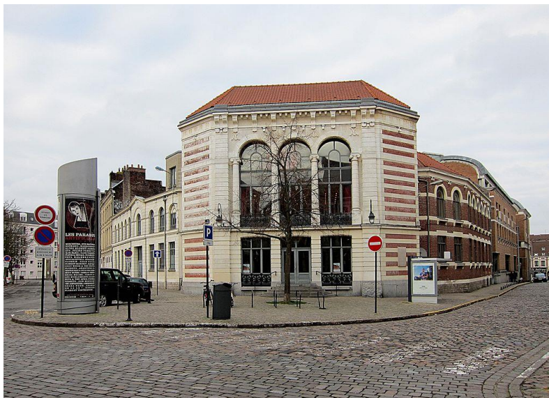
Conservatoire de musique de Lille