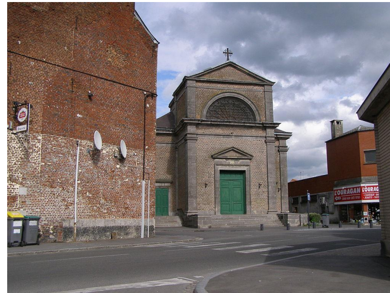
Eglise Saint Pierre Saint Paul de Landrecies