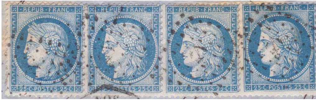
Planche 5, positions 137D5RIII 138D5 139D5 140D5RIII, bande de 4, types III II II III

Ces deux planches ont donné naissance aux fameuses paires, bandes ou blocs type II et type III se tenant.