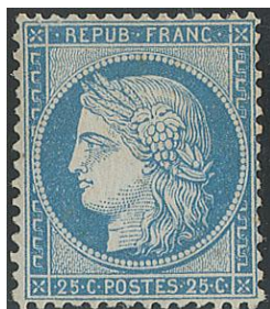
Le 25 centimes Cérès dentelé

Mon plus beau souvenir de philatéliste réside dans la démonstration de l'existence de la Planche 7, septième planche dans l'ordre chronologique utilisée pour l'impression du 25 centimes Cérès dentelé.